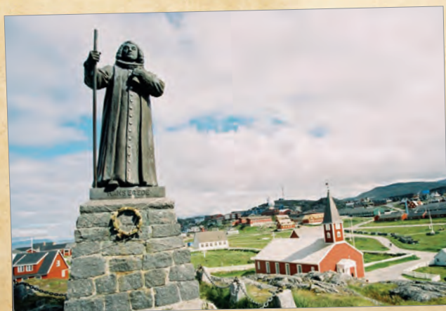
Hans-Egede-Statue in Nuuk, Grönland